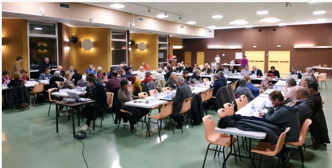
Conseil Communautaire du 28 janvier 2019 - Serres

La Communauté de Communes du Sisteronais-Buëch dispose de 3 RAM sur son territoire : l'île aux enfants, les Enfantsines, les Fruits de la passion, mais toutes les communes ne bénéficient pas du service. La volonté de la CCSB serait de structurer un service couvrant l'ensemble des communes membres, en valorisant et en utilisant les RAM existantes. La couverture du territoire permettait de mettre à disposition des familles : 3 sites d'accueil pour les permanences administratives (Serres, Laragne, Sisteron), des ateliers de jeux socialisants itinérants pour les enfants sur 10 communes tous les 15 jours et 88 assistantes maternelles. La CCSB prépare les étapes de cette mise en œuvre au fur et à mesure (repérage des lieux d'accueils, budgétisation, travail avec les CAF), pour une ouverture du service au 1er septembre 2019.